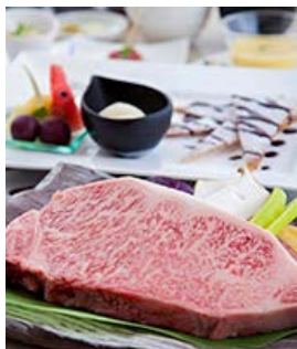
宮崎牛特撰ロースステーキ

(100g) 5,200円 (150g) 6,000円 (200g) 6,800円