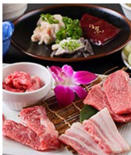
アパス堪能セット