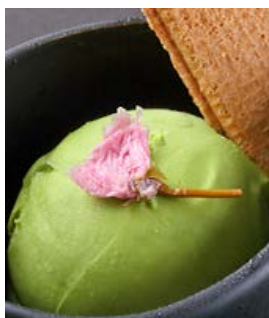
アイスクリーム(抹茶)