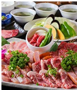
アパスファミリーセット