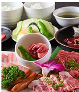
アパスペアセット