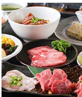
レディースコース